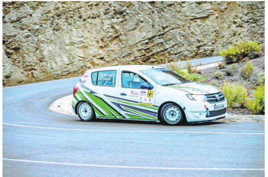
Los medios que se utilizarán están dotados de la más moderna tecnología. aca

Un sistema que también empleó en la pasada edición del Costa de Almería y este año en Cá-