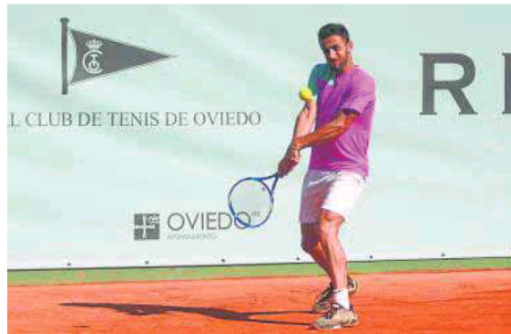
El almeriense busca seguir subiendo puestos en la AT.